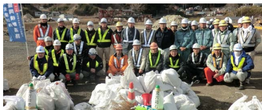
▲清掃完了（当協議会関係者）

※大型ダンプ約10台分の土砂を収集しました。 ※飛び石対策で主に小石を収集しました。