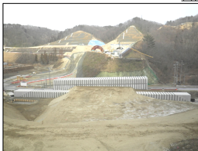
ボックスカルバート全景

宮古市千徳地区で実施していました千徳地区構造物工事が、1月30日をもって終了しました。この工事は、新設する宮古箱石道路と交差する、市道木戸井内隠里線及び木戸井内川へボックスカルバートを設置する工事と土工事（掘削、盛土、土砂運搬）を主体としました。 工事期間中は市道を迂回させ、通行の皆様には多大なご不便をお掛けしましたが、昨年11月には新設の市道ボックス内へと切替わっています。